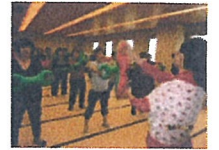
音楽に合わせて楽しく！