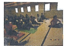
心地よい体操でリフレッシュ！